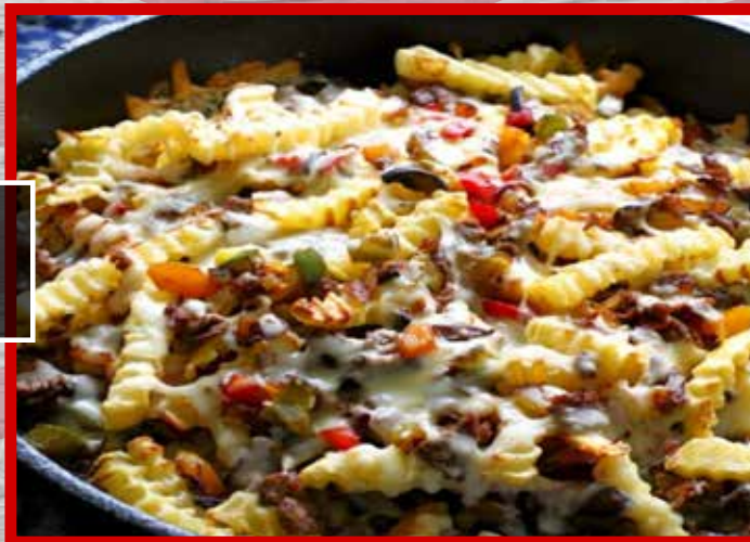
PHILLY STEAK FRIES WITH PEPPERS AND ONIONS. CON PIMIENTOS Y CEBOLLAS $29.500