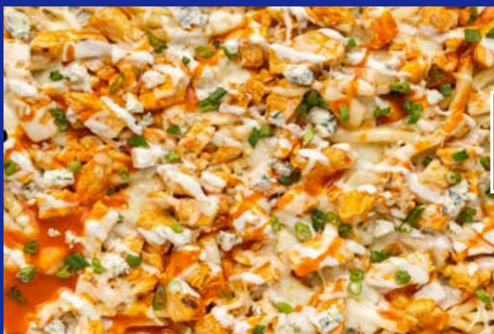
BUFFALO CHICKEN FRIES WITH PEPPERS AND ONIONS. CON PIMIENTOS Y CEBOLLAS $29.500