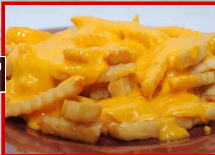
CHEESE FRIES / PAPAS CON QUESO $13.900