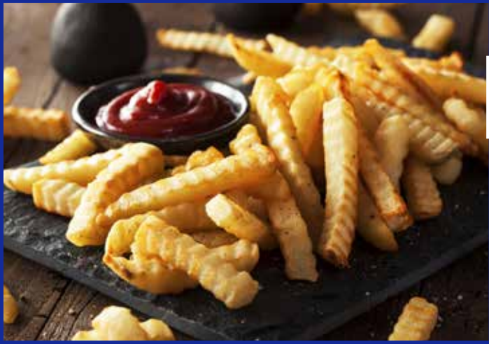
FRIES / PAPAS A LA FRANCESA $6.900